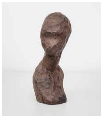
The Very White Marbles, Collection FRAC Île-de-France, © Marie Lund

Émotion esthétique et médiation culturelle sont proposées avec ces deux initiatives incontournables présentées aux enfants de notre Cité et à leurs proches. Venez vous étonner avec le Musée Mobile qui inaugure sur Issy-les-Moulineaux sa tournée en Ile-de-France et la rencontre avec une artiste des Arches, Emma Tandy.